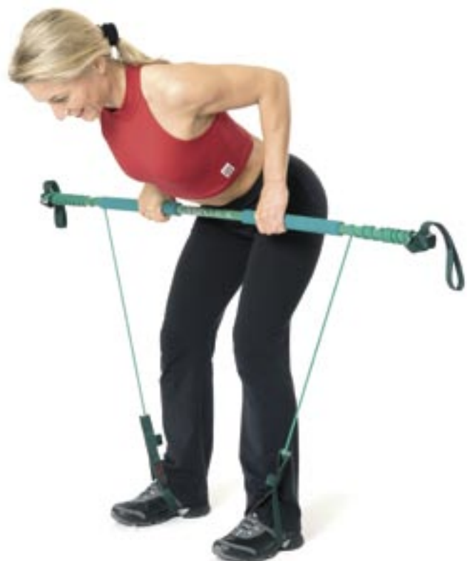
Abb. 1: Rudern vorgebeugt.

Übungshinweise: Halten Sie die Schulterblätter eher tief. Halten Sie den Rumpf und das Becken stabil und weichen Sie weder in ein Hohlkreuz noch in einen Rundrücken aus (Abb. 1).