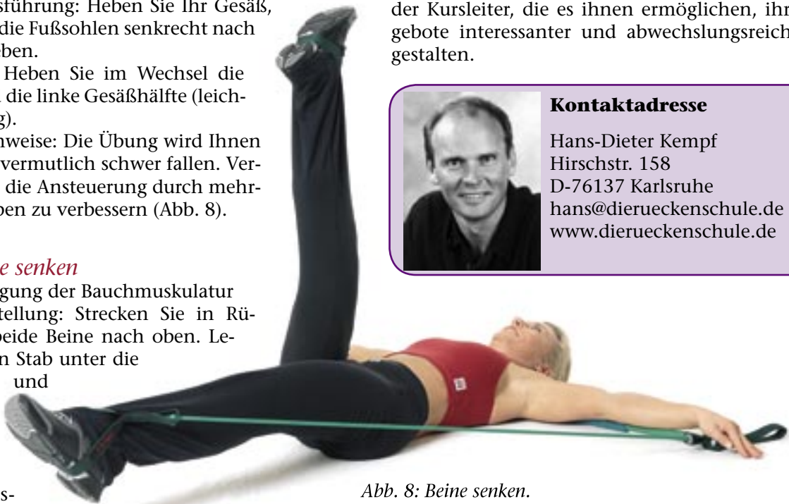
Abb. 8: Beine senken.

Ziel: Kräftigung der Bauchmuskulatur Ausgangsstellung: Strecken Sie in Rückenlage beide Beine nach oben. Legen Sie den Stab unter die Schultern und fixieren Sie ihn mit den Händen. Übungsaus-