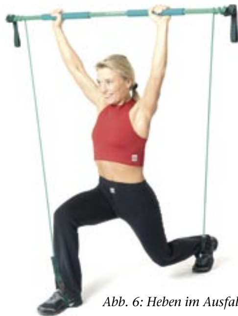
Abb. 6: Heben im Ausfallschritt.

Übungshinweise: Schieben Sie beim Beugen die Knie nicht nach vorne, sondern eher das Gesäß nach hinten. Tiefere Kniebeugen sind nur für trainierte Personen empfehlenswert. Fuß-, Knie- und Hüftgelenk befindet sich möglichst in einer Ebene (bei Beschwerden ist auch eine andere Ausführung zulässig).