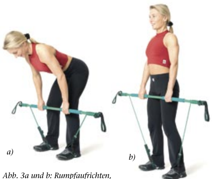
Abb. 3a und b: Rumpfaufrichten, Ausgangsstellung (a) und Endstellung (b).

Übungsausführung: Drehen Sie den Oberkörper in Richtung des aufgestellten Beines und kehren Sie wieder in die Ausgangsstellung zurück.