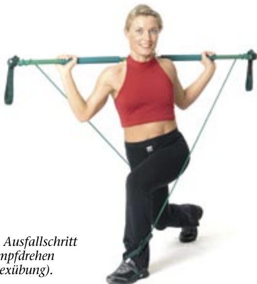
Abb. 5: Ausfallschritt mit Rumpfdrehen (Komplexübung).

Ziel: Kräftigung der Rumpf- und Beinmuskulatur Ausgangsstellung: Stehen Sie im aufrechten Stand. Übungsausführung: Gehen Sie in einen Ausfallschritt und drehen Sie den Oberkörper zum aufgestellten vorderen Bein. Richten Sie sich wieder auf. Übungshinweise: Halten Sie beim Drehen des Rumpfes die Beine ohne Ausweichbewegungen stabil im Einbeinstand. Führen Sie ggf. beide Bewegungen zunächst nacheinander durch (Abb. 5).