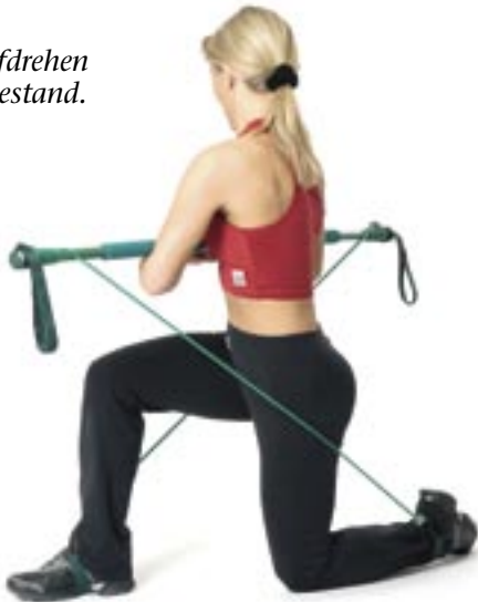
Abb. 4: Rumpfdrehen im Einbeinkniestand.

Variation: Führen Sie in der Endposition kleine Drehbewegungen durch.