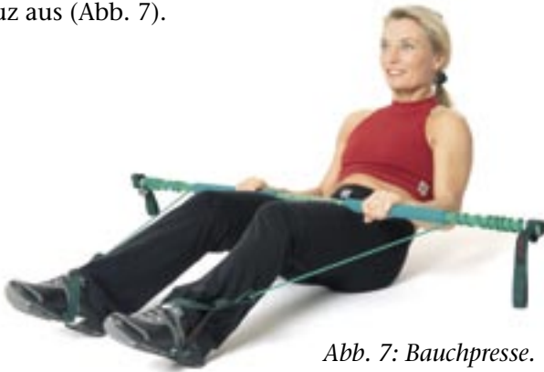
Abb. 7: Bauchpresse.

Ziel: Kräftigung der Bauchmuskulatur Ausgangsstellung: Legen Sie sich mit leicht gebeugten Beinen hin und halten Sie den Stab an den Oberschenkeln. Übungsausführung: Rollen Sie langsam den Oberkörper (etwa 30 Grad) bis kurz vor Abheben der Lendenwirbelsäule auf. Übungshinweise: Ziehen Sie in der liegenden Position leicht den Bauchnabel Richtung Wirbelsäule und weichen Sie beim Auf- und Abrollen nicht ins Hohlkreuz aus (Abb. 7).