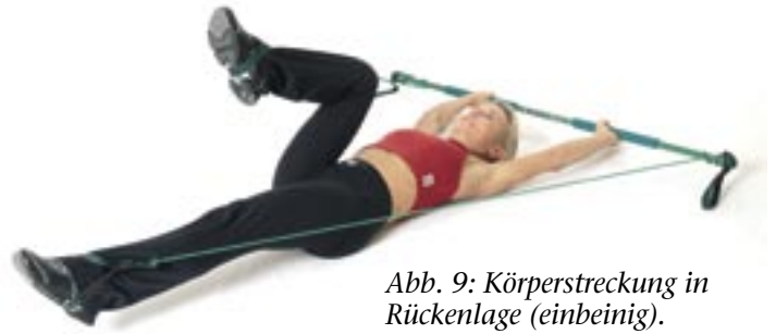
Abb. 9: Körperstreckung in Rückenlage (einbeinig).

führung: Ziehen Sie den Bauchnabel leicht Richtung Wirbelsäule um das Becken zu stabilisieren. Senken Sie ein Bein nach unten bis knapp über den Boden und heben Sie es wieder nach oben. Variation: Kombinieren Sie das Heben eines Beines mit dem Senken des anderen Beines. Übungshinweise: Um den Hebel zu verkürzen (leichtere Übung), können Sie die Beine auch anwinkeln.